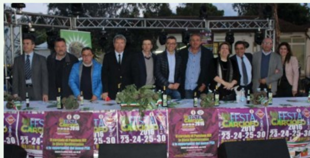
carciofo.JPG [ 87.37 KiB | Osservato 31 volte ]

Iscritto il: 13/03/2008, 19:23 Messaggi: 49078 Località: Pinzolo (TN) - Firenze Formazione: Laurea in Scienze agrarie